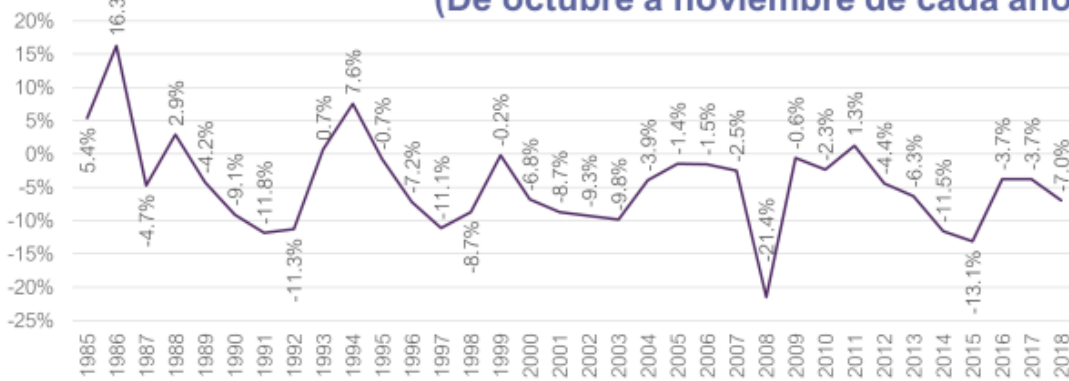
Cambio % importaciones provenientes de México (De octubre a noviembre de cada año)

Las importaciones de Estados Unidos cayeron 2.9% durante noviembre respecto al mes previo, mientras las exportaciones disminuyeron en 0.6% . La caída en las importaciones se derivó principalmente de una menor entrada de bienes petroleros. Asimismo, los aranceles que la administración estadounidense ha aplicado a bienes provenientes de China repercutieron en menores importaciones de los bienes provenientes de dicho país; durante noviembre, Estados Unidos importó 2.9 mil millones de dólares menos de bienes chinos. En el caso particular de México, las importaciones hechas por Estados Unidos cayeron en 7% mensual. Aunque usualmente las importaciones provenientes de México decrecen entre octubre y noviembre, la caída de 7% en las importaciones de noviembre de 2018 es mayor a la observada en los últimos 2 años, cuando éstas habían decrecido en 3.7% .